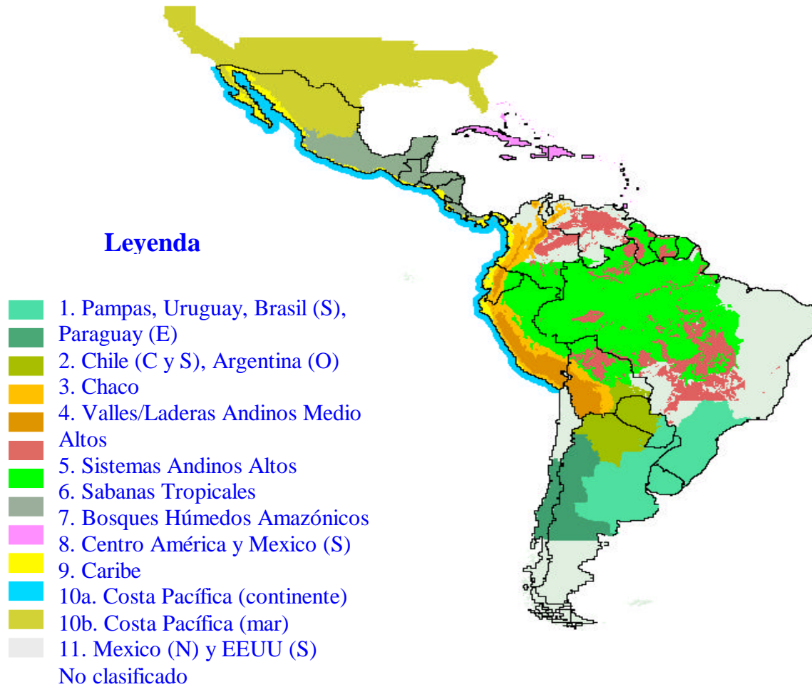
FIGURA 3. Megadominios para el FONTAGRO