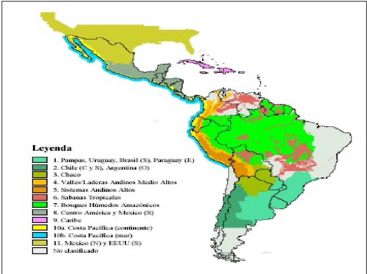
Figura 2. Megadominios del Fontagro.

occidente de Ecuador, los bosques del Atlántico, la sabana del Cerrado en Brasil, los Andes tropicales y el centro de Chile.