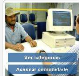
Financiamento e Proteção da Produção