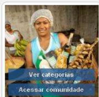
Diversificação na Agricultura Familiar Fumicultora