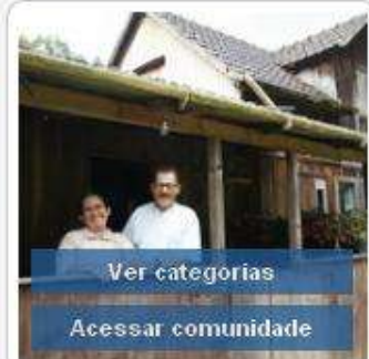
Turismo na Agricultura Familiar