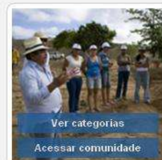
Formação de Agentes de Ater