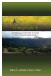
El libro sobre Ecoagricultura se publicó gracias al apoyo de la Universidad de California, Berkeley.

Alianzas estratégicas permiten fortalecer trabajo de cooperación para los países del hemisferio.