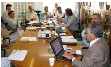
La misión está integrada por autoridades de Formosa y por especialistas del IICA.

Cooperó en la formulación del Programa de apoyo a la provincia de Formosa para implementar el Plan de Inversiones Formosa 2015.