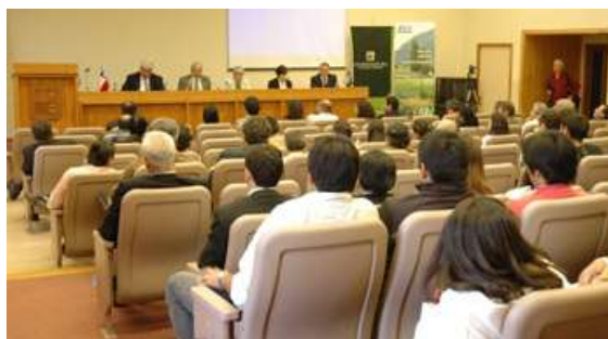
El Foro "La Agricultura Ampliada de América Latina y el Caribe frente a la Crisis Global: Desafíos y Oportunidades" tuvo una nutrida asistencia. Como expositores participaron expertos del IICA, de la CEPAL, de la FAO y del Instituto de Economía Agraria de la UACH y Presidente de la Asociación de Economistas Agrarios de Chile.