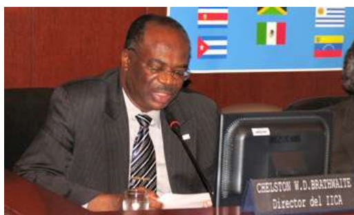
El Director General del Instituto se refirió a los desafíos globales de hoy ante el Consejo Permanente de la OEA.

El Director General del IICA presentó ante la OEA en Washington el Informe Anual del Instituto 2008.