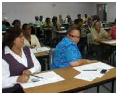
En el taller participaron más de 40 personas.

La actividad se enmarcó dentro del proyecto “Fortaleciendo el sector turístico, a través del desarrollo de vínculos con el sector agrícola del Caribe”.